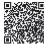
App für Android

Jetzt QR-Code scannen und VR SecureGo plus installieren.