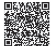
App für iOS